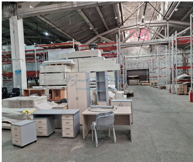
Фото 1 из 4