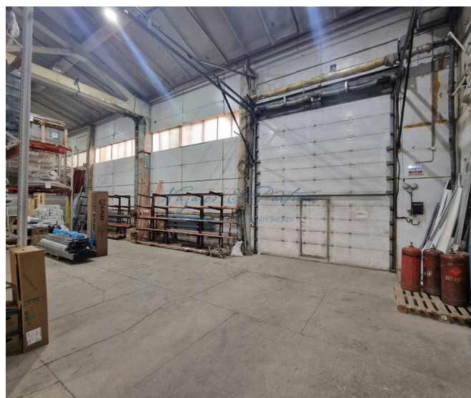
Фото 4 из 4