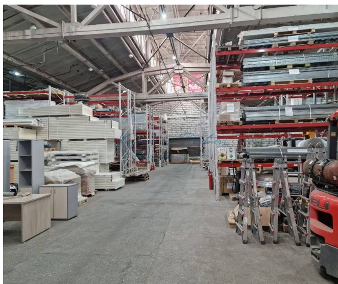
Фото 3 из 4